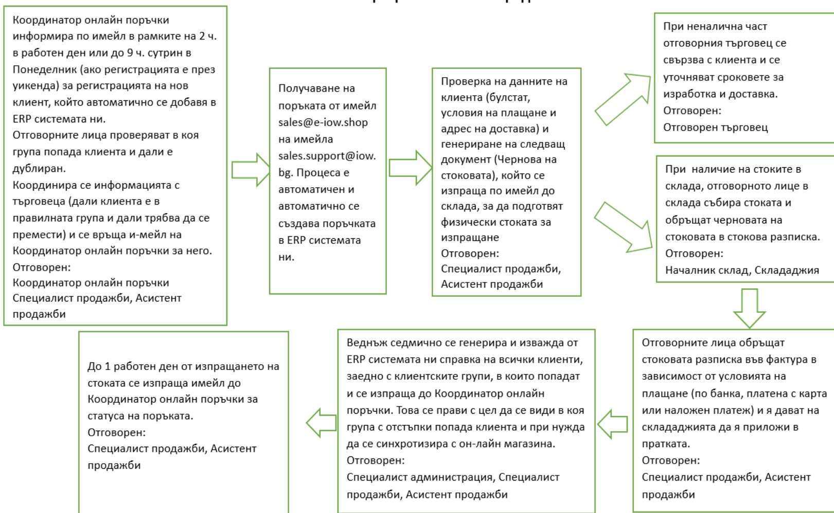
Схема на процеса на онлайн продажба

Онлайн магазина е напълно синхронизиран със системата ни за управление на бизнеса и клиента може да си набави от него продукти и избере начин на плащане и доставка на стоката.