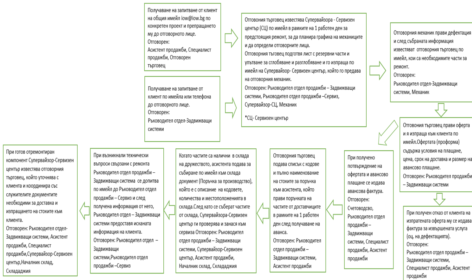
Схема на процеса ремонтна дейност на редуктор

Процеса сглобяване на редуктор обхваща асемблирането и доставката му към клиента.